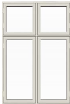
Dannebrogsvindue Sidehængt udadgående åbninger.