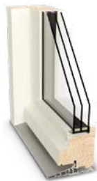
Rammedøre (facade- og terrassedøre)

Vælg din hoveddør med omhu - den skal være indbydende og matche husets stil og sjæl. Sortimentet giver mulighed for at designe en dør, der passer netop til dig og dit hus. NorDans facade- og terrassedøre er vel-egnede til såvel nybyggeri som renovering.