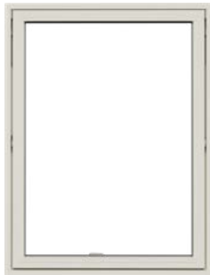
Topstyret vindue Med udadgående åbning.