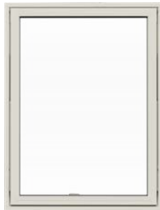
Top/vende vindue Med udadgående åbning.