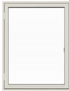
Sidehængt vindue Sidehængt vindue med udadgående åbning.