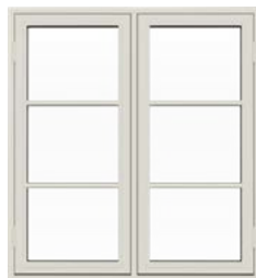
Bondehus vindue Med udadgående åbning.