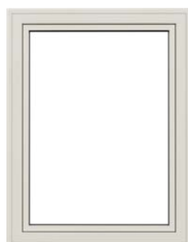
Drejekip Indadgående vindue der åbnes enten ved en dreje- eller kipfunktion.