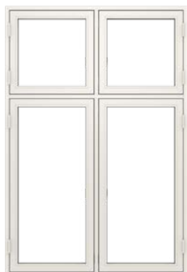
Dannebrogsvindue Sidehængt udadgående åbninger.