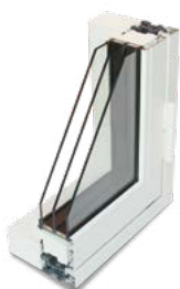
Rammedøre (facade- og terrassedøre)

Vælg din hoveddør med omhu - den skal være indbydende og matche husets stil og sjæl. Sortimentet giver mulighed for at designe en dør, der passer netop til dig og dit hus. NorDans facade- og terrassedøre er velegnede til såvel nybyggeri som renovering.