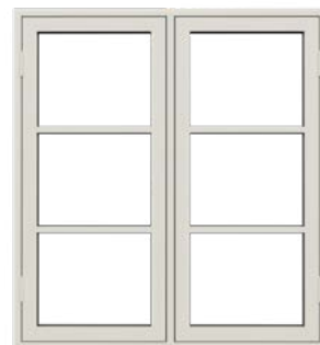
Bondehus vindue Sidehængt med udadgående åbning.