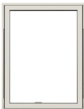
Top/vende vindue Med udadgående åbning.