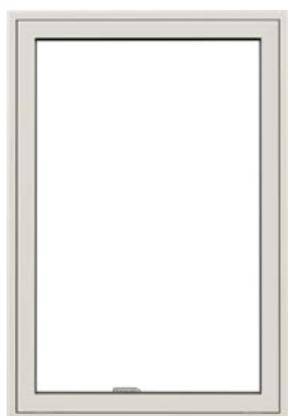
Topstyret vindue Med udadgående åbning.