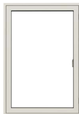
Sidestyret vindue Sidestyret vindue med udadgående åbning.